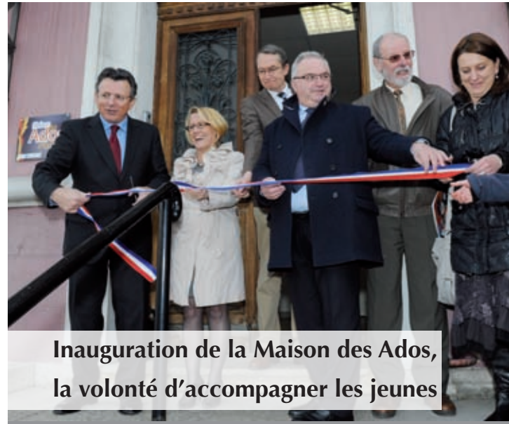
Inauguration de la Maison des Ados, la volonté d'accompagner les jeunes

La Maison des Ados d'Oyonnax est financée par la Ville d'Oyonnax, le Conseil général de l'Ain, la Région Rhône-Alpes (en 2012), la CAF, l'État. ■