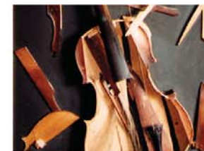
Image et musique - Instruments et lieux pour la pratique d'un art à part

« Vivre est une chanson, dont mourir est le refrain » Victor Hugo. La musique accompagne notre espèce depuis la nuit des temps. Les artistes ont régulièrement peint, sculpté, amoncelé, détourné, des instruments. Quelle lecture faire d'une nature morte hollandaise ou d'une sculpture d'Arman ? Quel portrait de la société de telles œuvres transmettent-elles ?