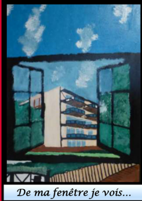
De ma fenêtre je vois...

De ma fenêtre je vois un banc Je vois le banc où ma mère s'asseyait avec ses amis Le banc où ma mère s'essayait au français De ma fenêtre je vois mon fils auprès de ma mère jouer au ballon De ma fenêtre je vois la maison de quartier que ma mère appelait « notre maison » De ma fenêtre je vois ce banc que j'aime regarder car il me rappelle ma mère et l'odeur de ces plats De ma fenêtre je vois le banc dont je suis la seule à connaître les histoires Et même si ce banc disparaît avec les travaux il sera toujours dans un coin de ma mémoire car il me rappelle ma vie d'enfant De ma fenêtre je vois l'histoire Bâtiments, construction, rénovation De nos fenêtres on peut tout voir.