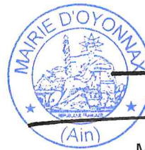
Michel PERRAUD Conseiller Départemental

Délibération certifiée exécutoire de plein droit conformément aux dispositions de l'article L 2131-1 et suivants du CGCT :