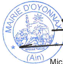
Michel PERRAUD Conseiller Départemental

Délibération certifiée exécutoire de plein droit conformément aux dispositions de l'article L 2131-1 et suivants du CGCT :