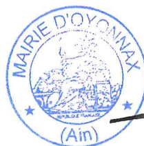
Michel PERRAUD Conseiller Départemental

Délibération certifiée exécutoire de plein droit conformément aux dispositions de l'article L 2131-1 et suivants du CGCT :