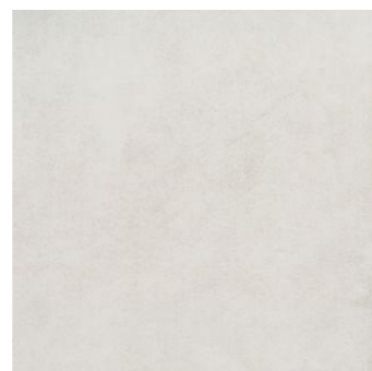
3 - Enduit couleur Pierre grisé finition talochée