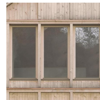
6 - Menuiseries et modénatures bois