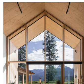
4 - Façade rideau à ossature bois