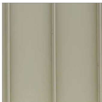
1 - Bardage Zinc à joint debout prépatiné vert